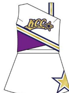
River (小4～中3) クラス