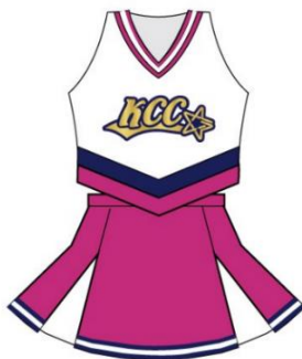
Bird (年中・年長) クラス