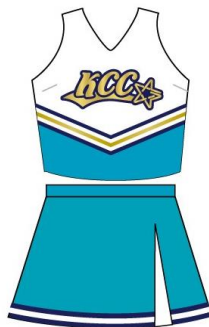
Animal (小1～小3) クラス